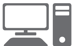
Puesto de trabajo

Bienvenido a la nube diseñada a tu medida, con opciones de software de gestión sencillas, portátiles, seguras y flexibles para negocios que viven el cambio