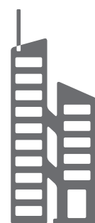
Data Center ekon

El software de gestión de ekon ha sido creado en la nube. Es su hábitat natural. Pero nuestras soluciones te ofrecen mucho más que un perfecto servicio cloud . Tienes a tu disposición todo su potencial, sea cuál sea la modalidad de despliegue que elijas: una cloud pública, privada o en tus instalaciones (On-Premises).